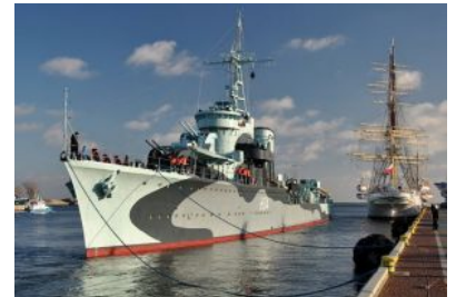
ORP "Błyskawica" - okręt muzeum

1 grudnia 1937 na podejściu do Gdyni nowy kontrtorpedowiec został uroczysto powitany przez „Wichra” w asyście dwóch trałowców. Tak opisywał to powitanie znany publicysta morski Julian Ginsbert na łamach miesięcznika "Morze": "... o godzinie 9.30 terytorium polskie powiększyło się znów o półtora tysiąca metrów kwadratowych. Albowiem o tej godzinie stanął przed wejściem do portu gdyńskiego Okręt Rzeczypospolitej i grzmiał z dział salut z trzynastu strażów - oddał się pod rozkazy admirała-dowódcy Floty. "Błyskawica" - siostrzany kontrtorpedowiec "Groma" - a właściwie przewodnik kontrtorpedowców - stanowi z tymże "Gromem" zespół najsilniejszych w swej klasie okrętów na Bałtyku, będąc jednocześnie ostatnim wyrazem techniki wojenno-morskiej."