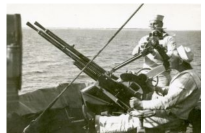
ORP "Błyskawica" - nkm Hotchkiss 13,2 mm plot