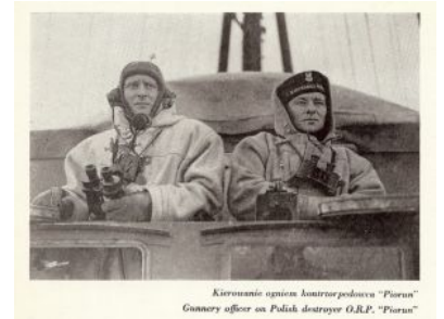
Kierowanie ogniem dział przez polską „Piorun” Gunners officer on Polish destroyer O.R.P. "Piorun"