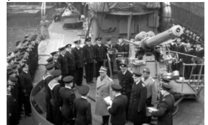
Gen. Sikorski na ORP "Piorun"