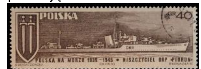
Znaczek Poczty Polskiej z 1970