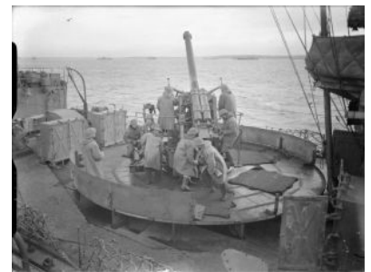
Stanowisko armaty 102 mm plot.