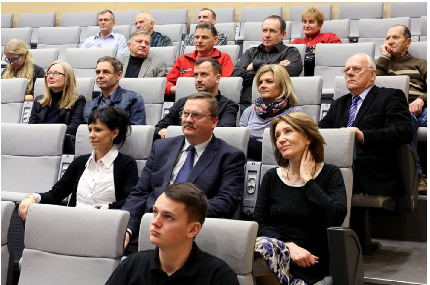
05.12.2014 - PROMOCJA PAMIĘTNIKA GDYNIA - OTTAWA