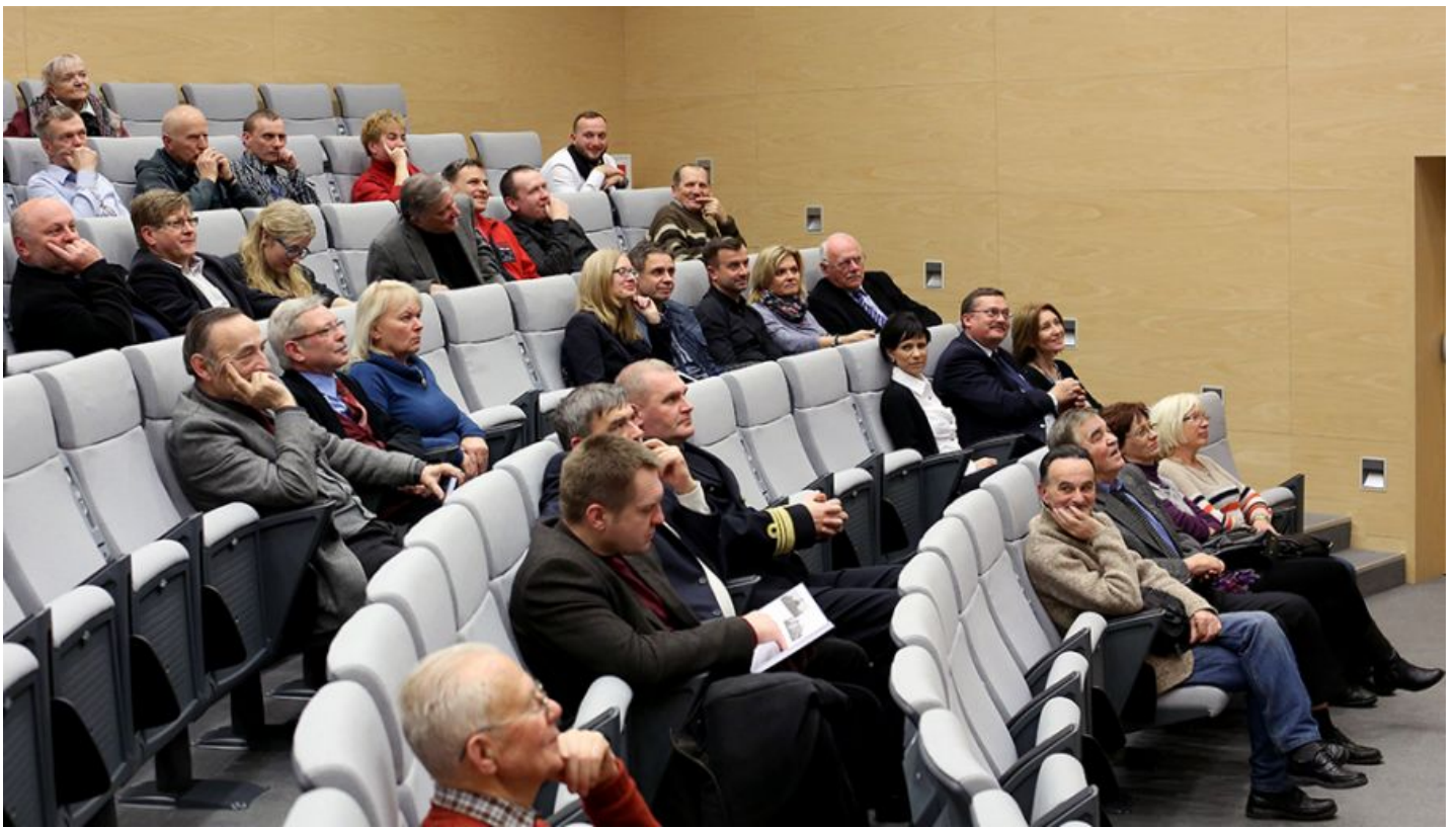
05.12.2014 - PROMOCJA PAMIĘTNIKA GDYNIA - OTTAWA