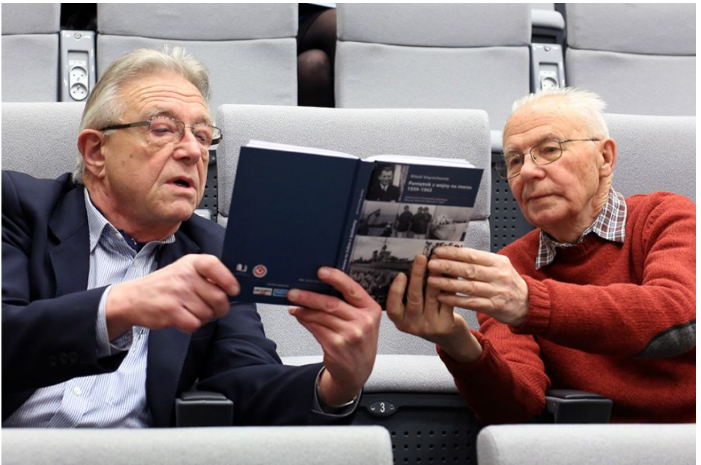
05.12.2014 - PROMOCJA PAMIĘTNIKA GDYNIA - OTTAWA