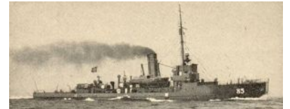
Trałowiec "M 85" (wg. Weyers Flottentaschenbuch)