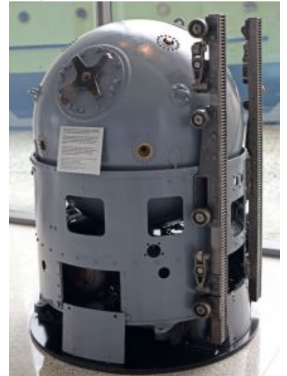
Mina SM-5 - eksponat w zbiorach MMW