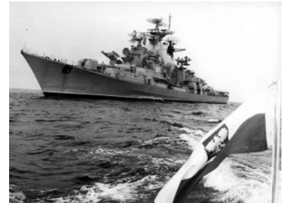
ORP "Warszawa" - poniżej odpalenie pocisku RZ 61

Niszczyciel rakietowy "Warszawa" był trzecim okrętem tej nazwy w polskiej Marynarce Wojennej - pierwszym był monitor rzeczny typu "gdańskiego"