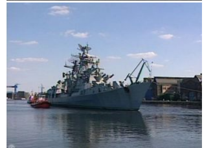
"Warszawa" holowana na złom w Stoczni Gdańskiej