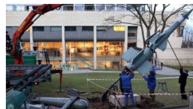
Rakieta RZ 61 - ekspozycja MMW

KALENADARIUM HISTORYCZNE MMW - PATRZ TUTAJ