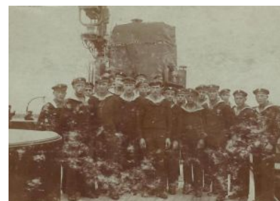
Marynarze z monitorów

Puck był pierwszą bazą floty, a w Gdańsku podniesiono polskie bandery na pierwszych w historii okrętach bojowych zamówionych przez naszą Marynarkę Wojenną. Były to cztery monitory rzeczne zbudowane z myślą o wzmocnieniu naszych sił zbrojnych w walce o wschodnie granice. Na wojnę polsko-bolszewicką nie zdążyły - przez całe międzywojenne dwudziestolecie stanowiły trzon sił Flotyli Pińskiej.