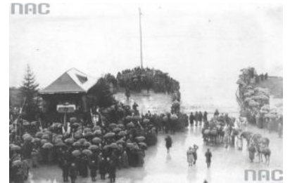
Zaślubiny Polski z morzem na fotografii....

Rok 1920 to także pierwsze pojawienie się floty na wodach Bałtyku biało-czerwonej, wojennej bandery, którą podniósł niewielki okręt hydrograficzny ORP "Pomorzanin".