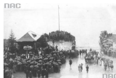
Zaślubiny Polski z morzem na fotografii....

Rok 1920 to także pierwsze pojawienie się na wodach Bałtyku biało-czerwonej, wojennej bandery, którą podniósł niewielki okręt hydrograficzny ORP "Pomorzanin".