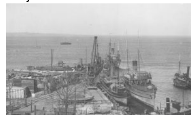
Puck - pierwsza baza polskiej floty