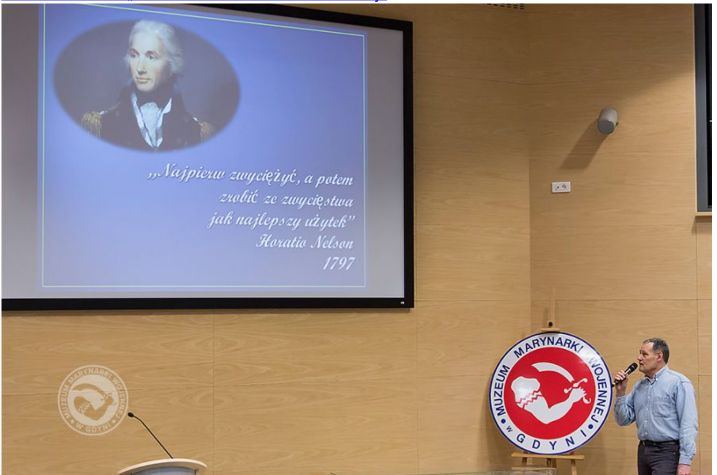
23 LUTEGO 2017 - „OPowieści spod BIAŁO-CZERWONEJ”