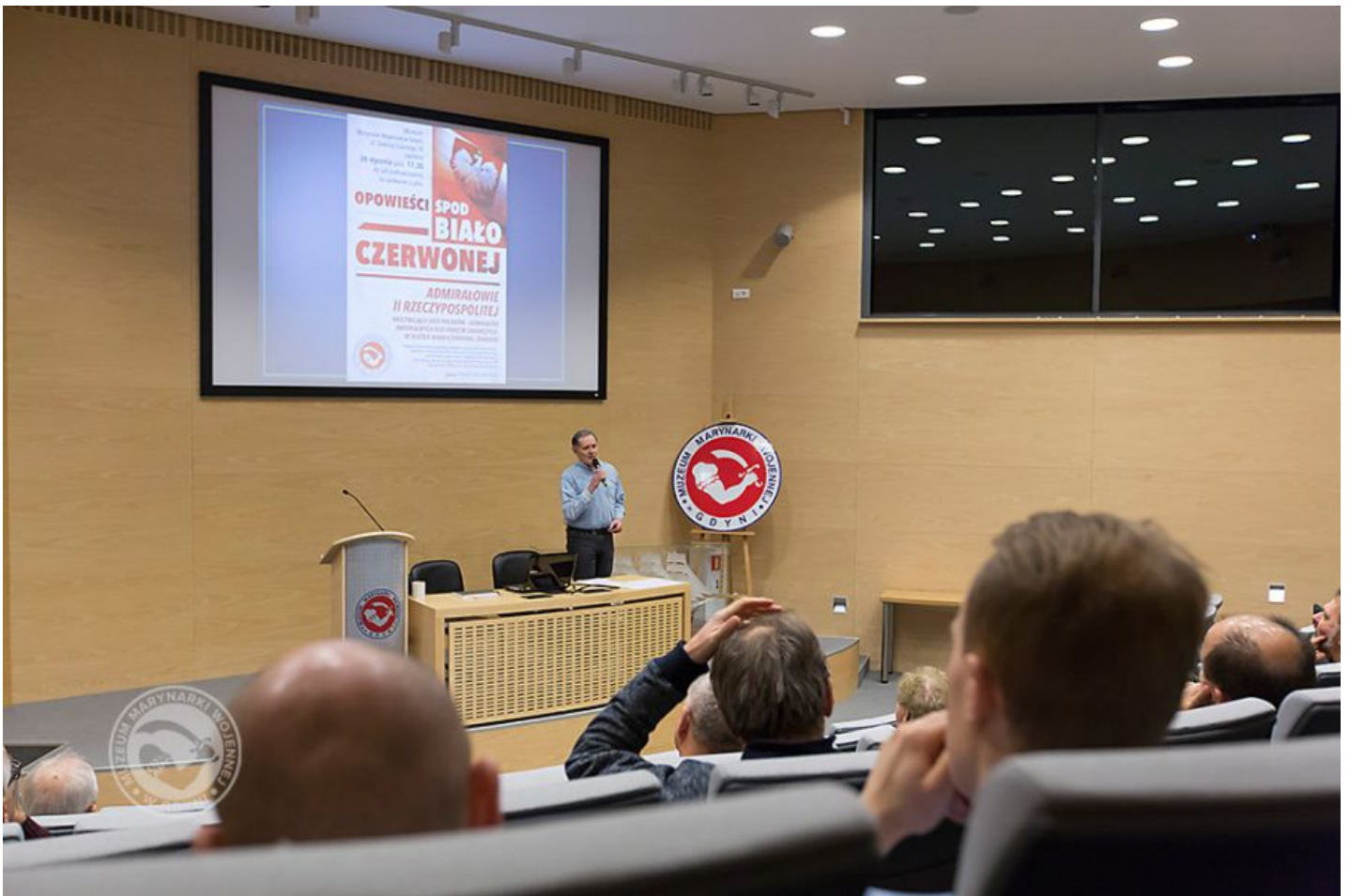
23 LUTEGO 2017 - „OPowieści spod BIAŁO-CZERWONEJ”