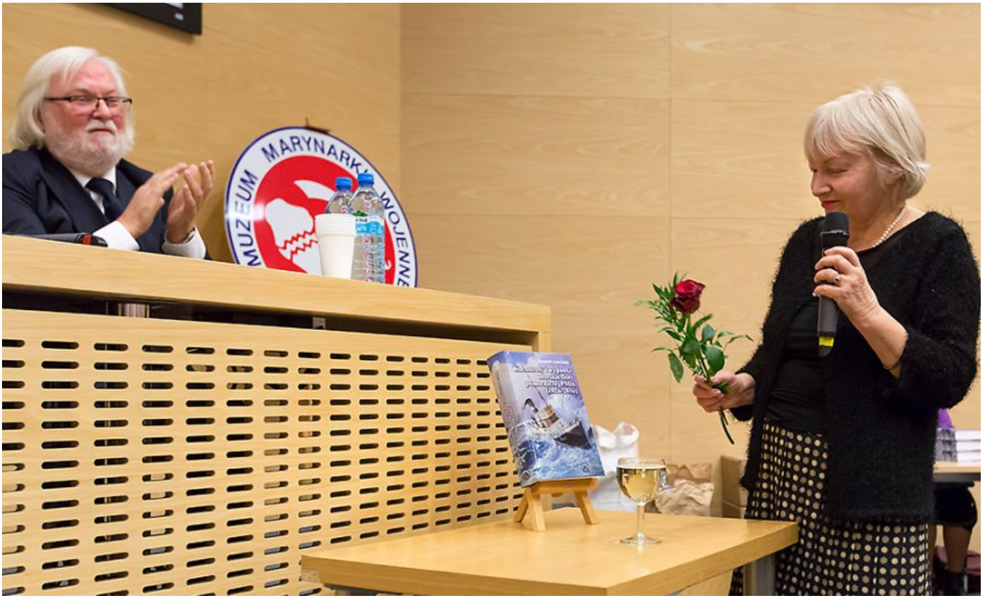
Wydruk ze strony: www.muzeummw.pl