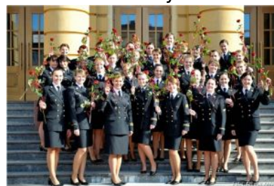
AMW - Gdynia