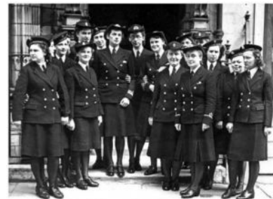
PMSK - Wielka Brytania