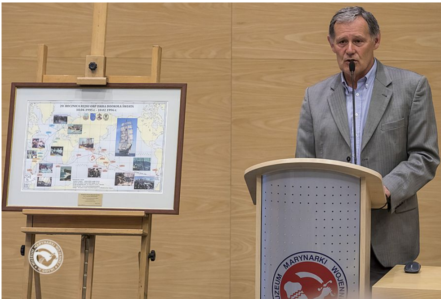
NASZE SYGNAŁY - DOKOŁA ŚWIATA POD BIAŁO-CZERWONĄ BANDERĄ