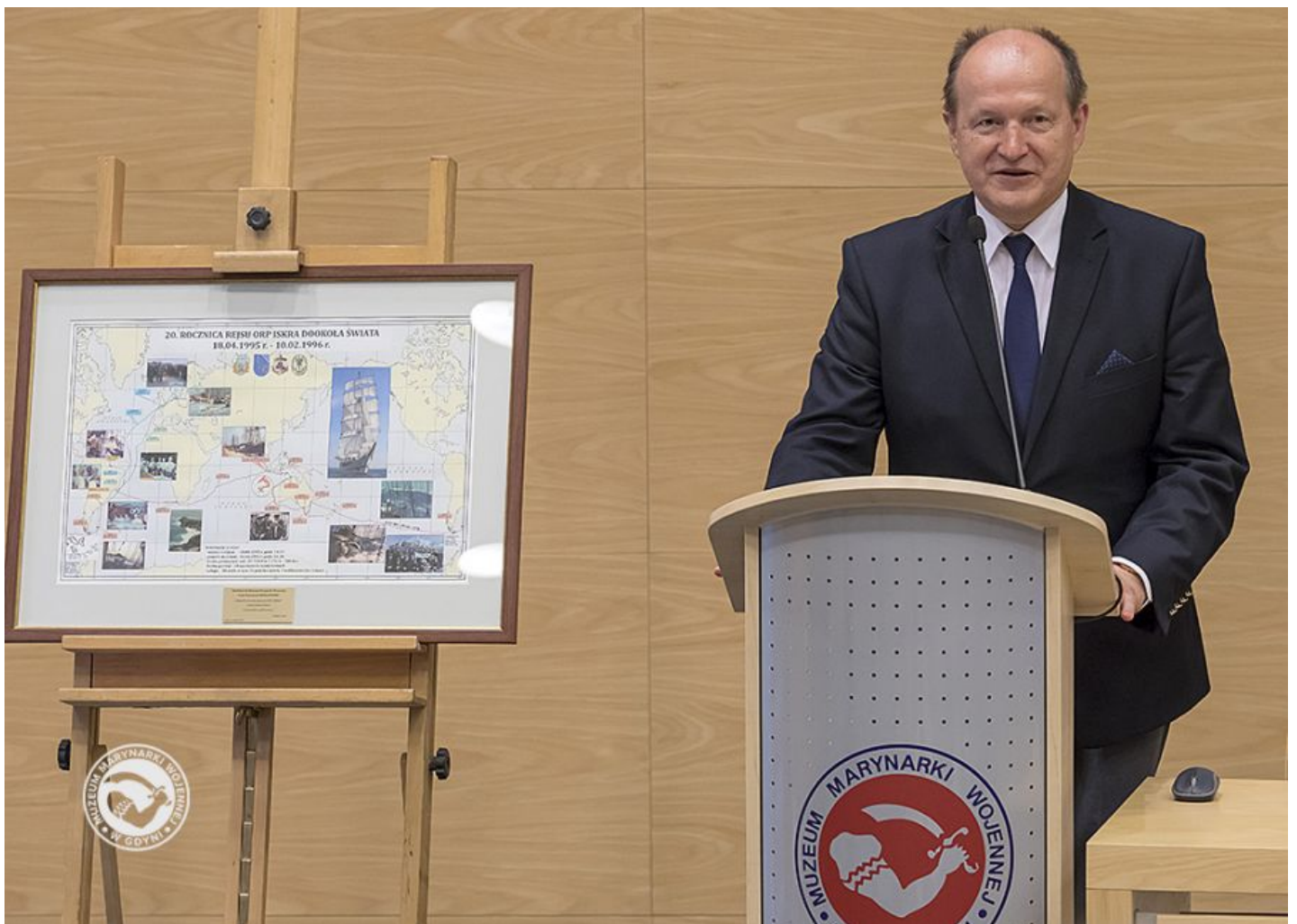
NASZE SYGNAŁY - DOKOŁA ŚWIATA POD BIAŁO-CZERWONĄ BANDERĄ