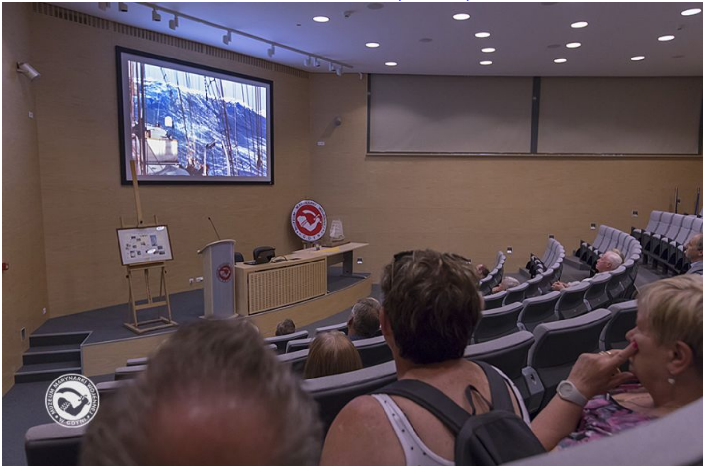
NASZE SYGNAŁY - DOKOŁA ŚWIATA POD BIAŁO-CZERWONĄ BANDERĄ