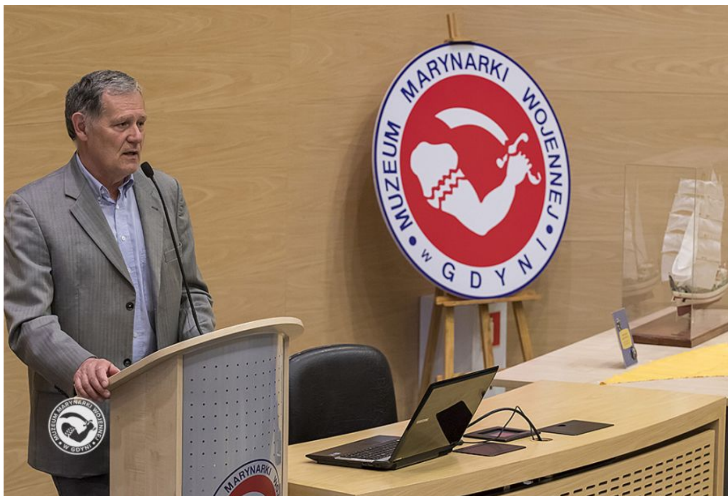
NASZE SYGNAŁY - DOKOŁA ŚWIATA POD BIAŁO-CZERWONĄ BANDERĄ